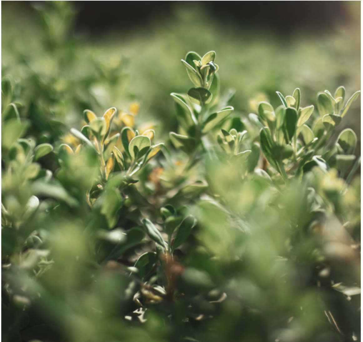
MUDON MASTER PLAN