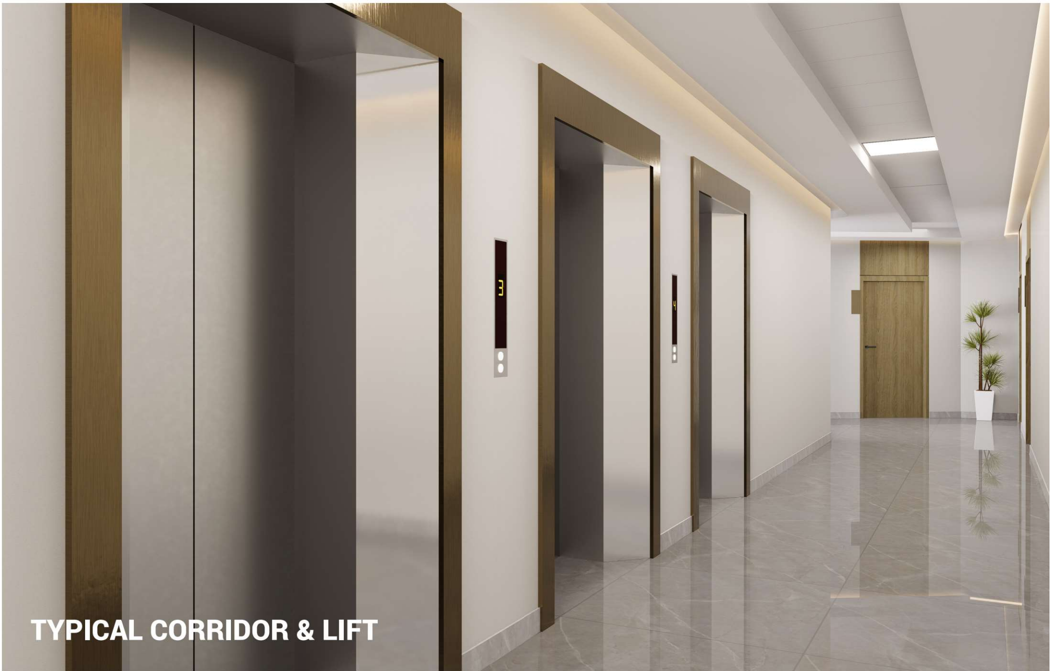
TYPICAL CORRIDOR & LIFT